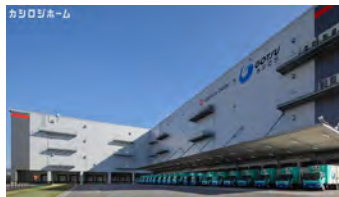
お菓子業界様共同配送拠点 (大阪府松原市)