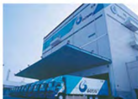
ハイエンド便™ 関西拠点 (大阪府高槻市)