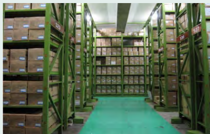
合通ロジOSセンター内観

書類保管_集荷・配達対応 (東京・首都圏) 書類保管_溶解処理・溶解証明書発行 (東京・首都圏) 書類保管_集荷・入出庫・配達・廃棄処理・ 書類保管_WEB管理システム (入出庫依頼・在庫照会) 書類保管_安心の取引実績_金融機関・流通企業